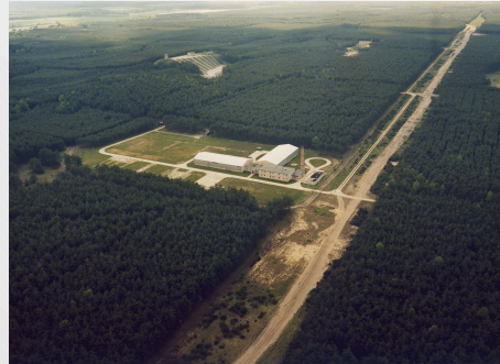
Abbildung 1: Luftaufnahme des BAM-Standortes Horstwalde

Die hier dargestellten Informationen spiegeln den Diskussionsstand wieder, die Konzeption ist noch nicht abgeschlossen/ genehmigt.