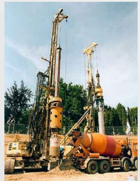
Abbildung 3: Pfahlherstellung ( http://www.demler.de )