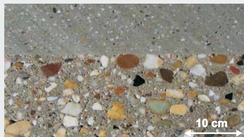
Abb. 4: Grundkörperbeton mit applizierter Spritzmörtelschicht im Anschnitt