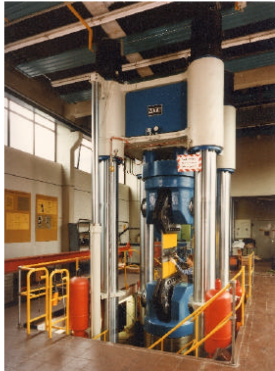
Prüfmaschine mit Flachprobe (Breite 1000 mm, Dicke 40 mm) zur Ermittlung bruchmechanischer Kennwerte

Somit wird die Sicherheit bei der Dimensionierung und Bemessung von großen Bauteilen wesentlich erhöht.