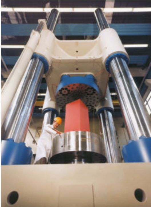
Blick in den Prüfraum der Prüfmaschine